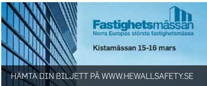
HÄMTA DIN BILJETT PÅ WWW.HEWALLSAFETY.SE