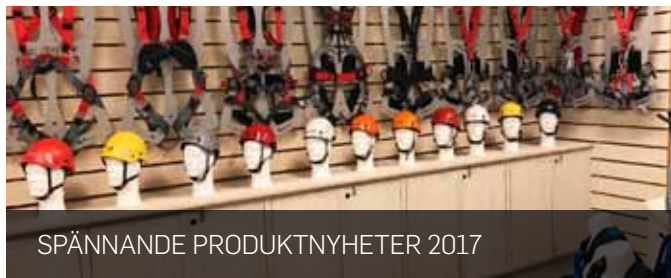
SPÄNNANDE PRODUKTNYHETER 2017