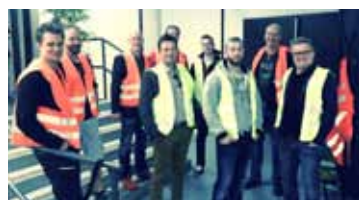
Ett gäng nybakade certifierade installatörer plats i Österrike.

Välkommen att höra av dig till oss på Hewall Safety så berättar vi mer!