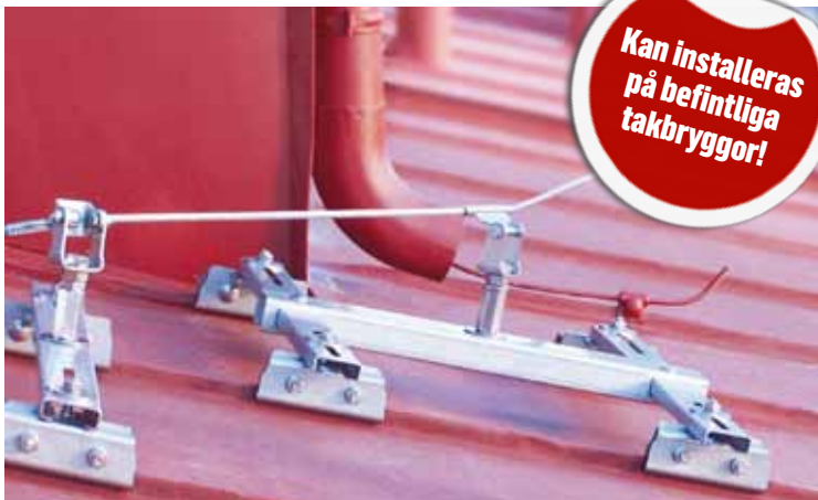
Exempel på AIO fallskyddssystem, här monterat på ett falsat tak.